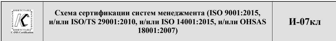
Схема сертификации – система оценки соответствия, связанная с системами менеджмента, к которым применяются одни и те же установленные требования, специальные правила и процедуры.